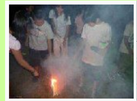
8/1 公民館で宿泊・花火