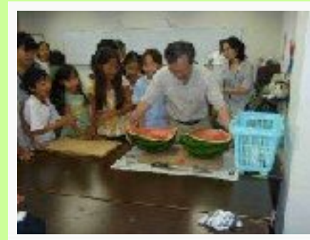
8/2 公民館宿泊・スイカ割り