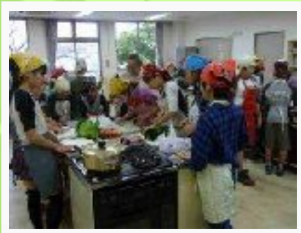
3/13 お別れ料理パーティー

【見学した所】 葉山しおさい博物館 こどもの国（横浜市） 山梨県八ヶ岳自然ふれあいセンター 北杜市オオムラサキセンター 山梨県・桔梗屋本社工場