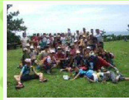
6/20 葉山しおさい博物館