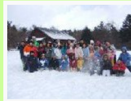
2/6 八ヶ岳宿泊・清里にて