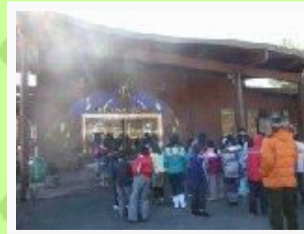
2/7 北杜市オオムラサキセンター