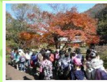
11/28 湘南モノレール沿線散策