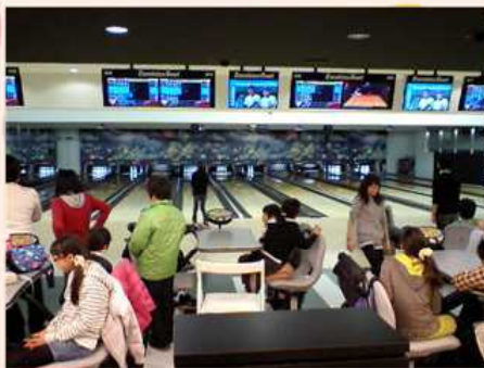
3/26 お別れボウリング大会