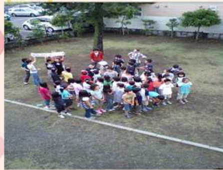
6/19 鵜沼海岸映画祭撮影