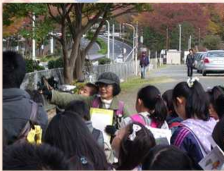
11/20 秋の大庭地区自然観察