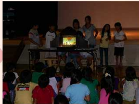
8/7・8 公民館宿泊・紙芝居上演

2010年度のテーマは、 「思いっきり遊ぼう！」。 近いのに意外と知らない江の島探検、 沢山遊んだ夏の公民館宿泊、 自然いっぱい秋の大庭地区、 冬遊びを満喫した八ヶ岳、等々、 様々な活動を通して学びました。