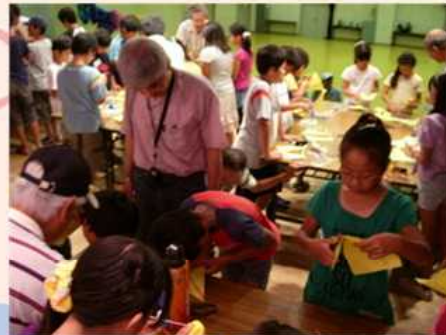
8/7・8 公民館宿泊・エンプレイン工作