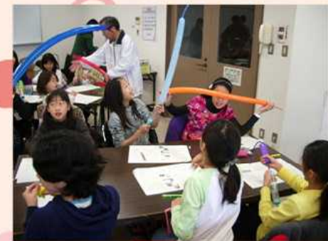
12/18 科学教室・静電気について