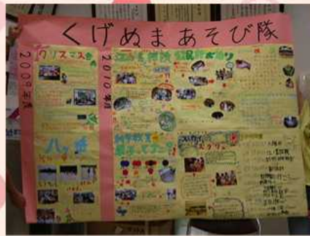
10/16 新聞づくり10/16 公民館まつり