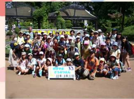
9/11 横浜・野毛山動物園