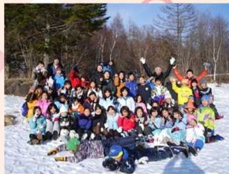
2/26 八ヶ岳宿泊・美鈴池にて