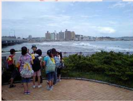
6/19 江の島探検ガイド付き