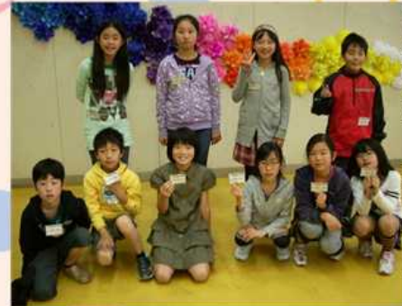
6/19 初顔合わせ・一年間よろしく！

応募者数が大変に多く、 事業開始以来初めての 「抽選」をすることに。 定員を増やして、48人でスタート。