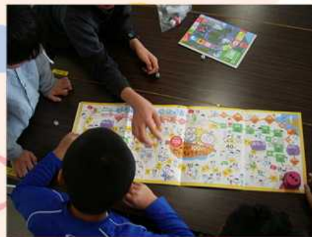
1/15 正月遊び・双六挑戦中