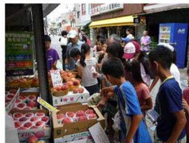
公民館前の鵜沼海岸商店街へ買い物。いつもまけていただき恐縮です。