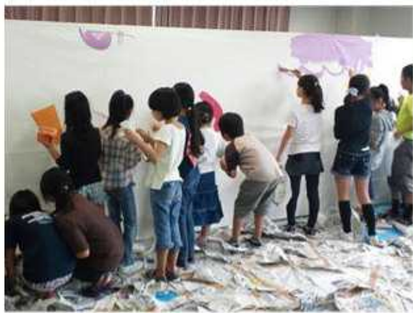
色塗り開始。ペンキが垂れないように、慎重に…。