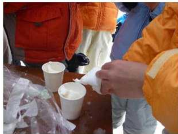
美鈴池で食べたアイスは格別の味でした。ご馳走様！！