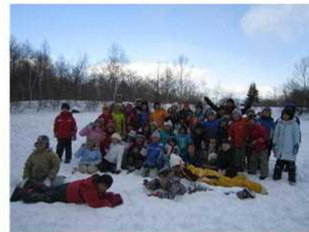
全員で、はい！チーズ！！