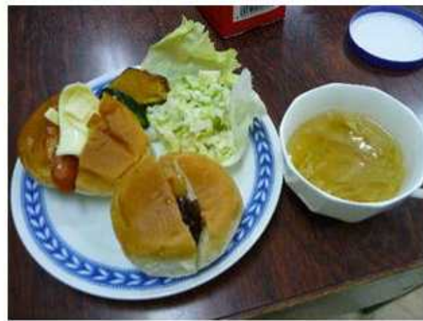
朝食はパン。ソーセージ等をはさんで食べました。