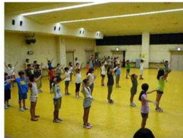
翌朝。外はすでに暑いので、館内でラジオ体操。まだ眠たそうですね。