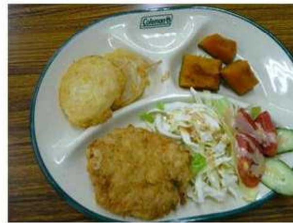
オニオンフライ、かぼちゃの煮物、サラダを添えて、完成！