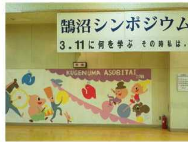
2枚描きました。 ホールの壁画はこちら。 (10/22撮影)