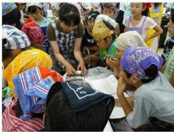
キッチンばさみを使ってアジを開きます。まずはデモンストレーション。