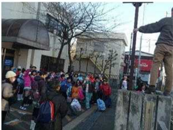
公民館に集合。みんな揃ってる？