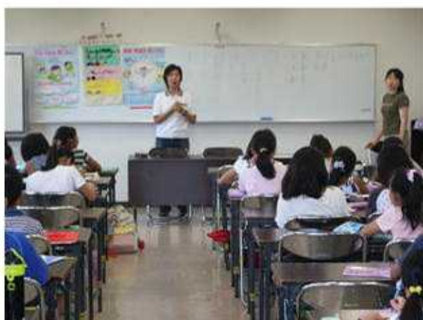
講師：藤沢市食生活改善推進団体四ツ葉会うめグループの皆さん。まずは食育についての話。