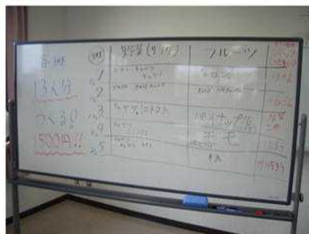
夕食はアジフライ。付け合せの野菜をどうするか、班で話し合いました。