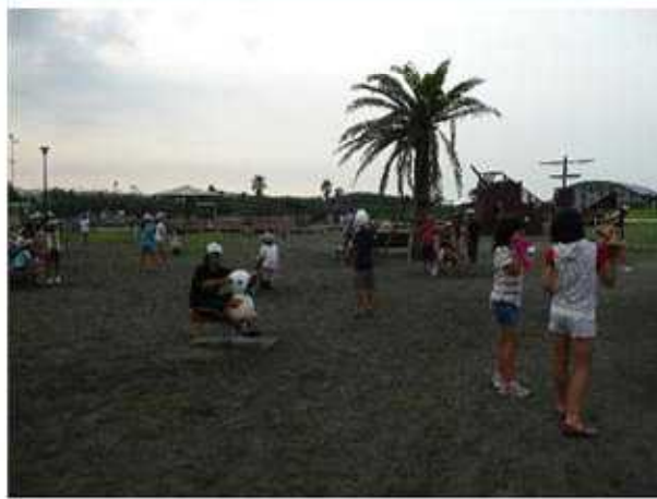
早朝の鵜沼海岸散歩。蒸し暑く、遊びたい気持ちと帰りたい気持ちが半々でした。