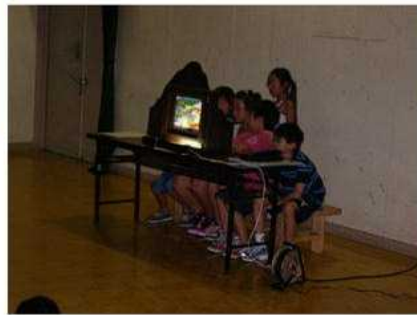
千代松さんと隊長が演じた後、班ごとに発表。怖い内容にブルブル。夢に出てきそう？