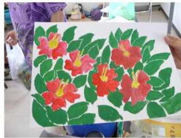
公民館まつりに展示する「みどりの絵」を描いて、お泊まり会は終了。