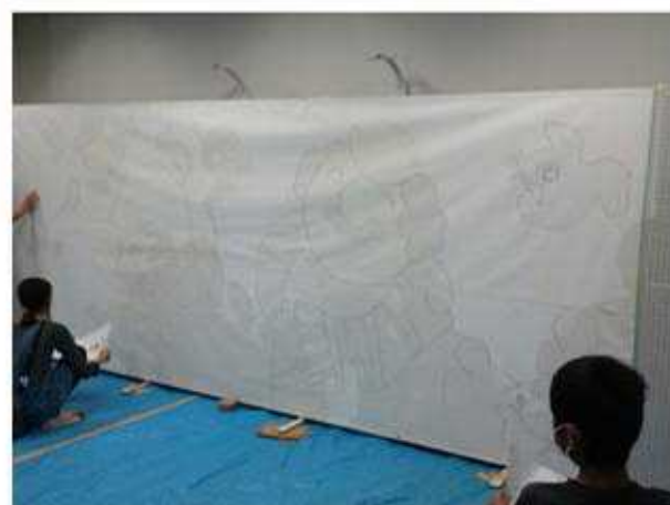
うっすらと映っています。