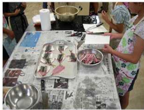
はじめは悪戦苦闘、次第に上手にできるようになりました。