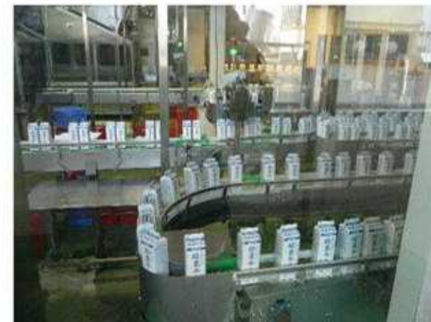
野辺山駅前、ヤツレン工場で見学と昼休憩。