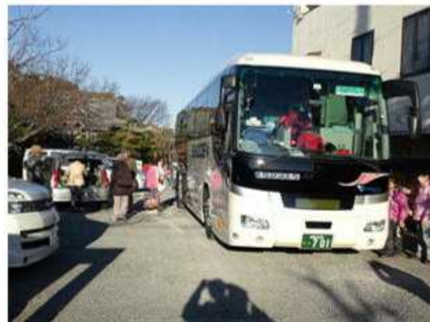
江ノ電バス鶴沼車庫が廃止されたため、伏見稻荷の駐車場から乗車。