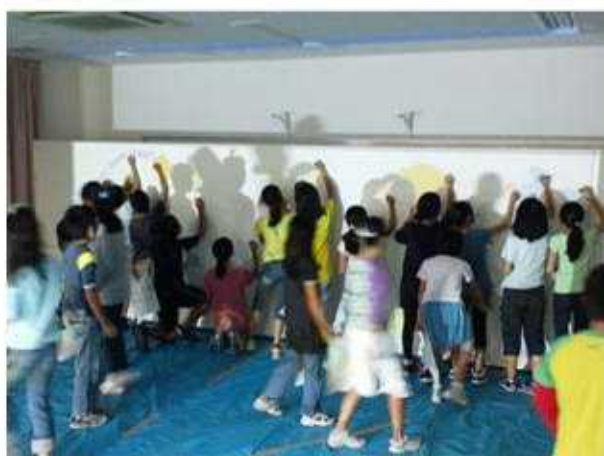
プロジェクターで絵を壁に映してから、下書き。