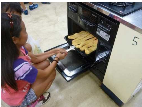
メニューは、インドチキンカレー、 ナン、サラダ、ラッシー。全部とて も美味しくできました。