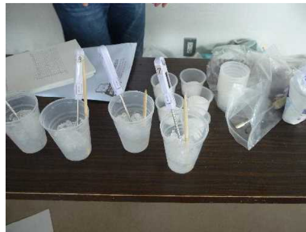
実験その2。氷に塩を入れると温度 が下がるのは有名な話。塩ではなく 砂糖を入れると、どうなるの???