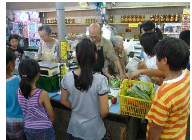
食育学習～買物～調理実習。 八百力商店の皆さん、今年も大変お 世話になりました！！