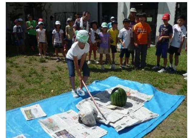
翌朝は、ラジオ体操、朝食…すいか 割り。八百力商店で、特大で超甘の すいかを購入。楽しい2日間でした。