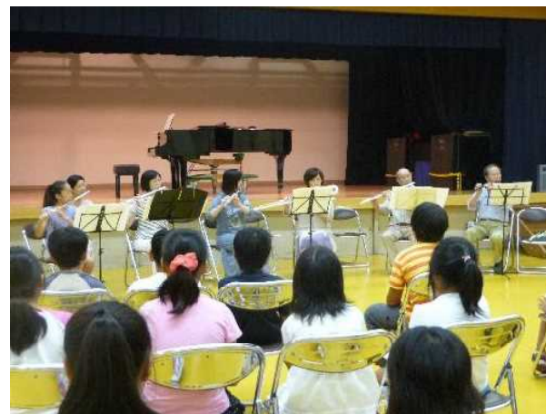
夜は、フルーツ演奏会と体験。 この後、スタッフの持ち寄り楽器で の演奏も。